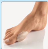
Ballenhaube Art.-Nr. 137 140

Nicht bei offenen Wunden anwenden. Bei Diabetes, Entzündungen oder Gefäßkrankungen vor Anwendung den Arzt befragen!